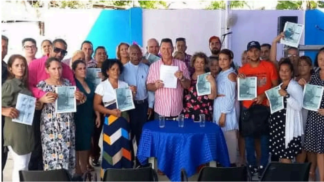
Miembros de la ACC en su reunión fundacional, en 2022

Como colofón de su Sexta Reunión Nacional, la Alianza de Cristianos de Cuba lanzó duras críticas al régimen por la situación del país