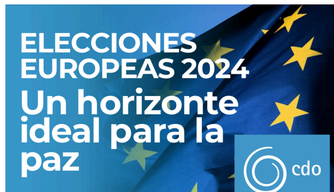
Manifiesto: "Un horizonte ideal para la paz"

Con motivo de las próximas elecciones al Parlamento Europeo, la Asociación Compañía de las Obras , constituida por personas afines a Comunión y Liberación, ha publicado un manifiesto titulado " Un horizonte ideal para la paz " que se presentará públicamente hoy martes