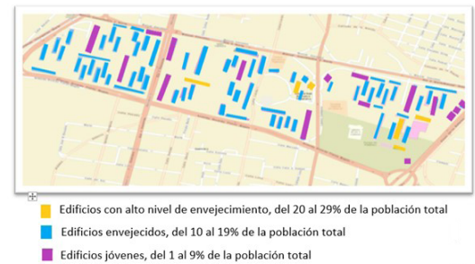
Mapa 1. Tlatelolco: edificios clasificados según la proporción de personas de 65 años y más.