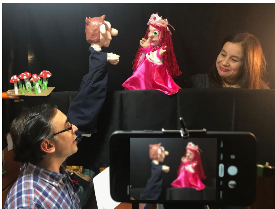
Figura 2. Ensayo de la Obra “Rosita y el Duende Mágico”. (Fotografía Mariana Álvarez. Estudiante de Periodismo UCSC).

transmisión fue a través de un teléfono celular, el cual presentaba diversas restricciones de tipo técnico, como la dificultad para poner textos y logos en pantalla durante la emisión o la insuficiente calidad de la señal de audio. Aun así, la audiencia se mantuvo. Posteriormente se logró realizar la transmisión a través de un computador y la incorporación de un software de streaming que permitió mejorar la calidad técnica puesta en el aire. Tanto las grabaciones, como los ensayos y emisiones se hacían desde un espacio reducido al interior de la casa habitación, donde se adaptó la sala de estudio para estos fines (Figura 2).