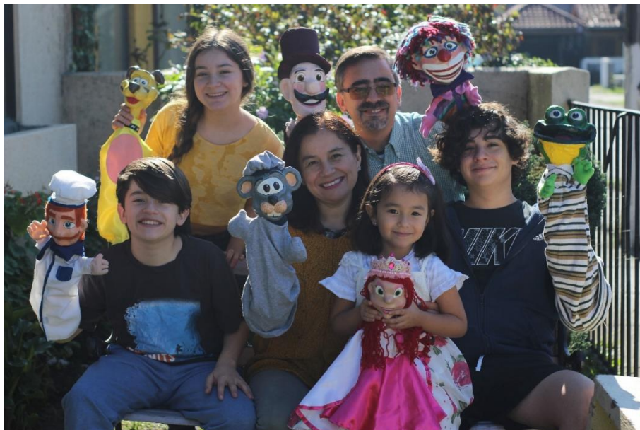
Figura 1. Compañía familiar de Títeres Sesenta Deditos.

El hecho de que los 6 integrantes de la Compañía Familiar de Teatro de Títeres Sesenta Deditos, dirigida por los académicos se encontraba confinada en la misma residencia, se valoró como una oportunidad y se involucraron todos en el trabajo (Figura 1).