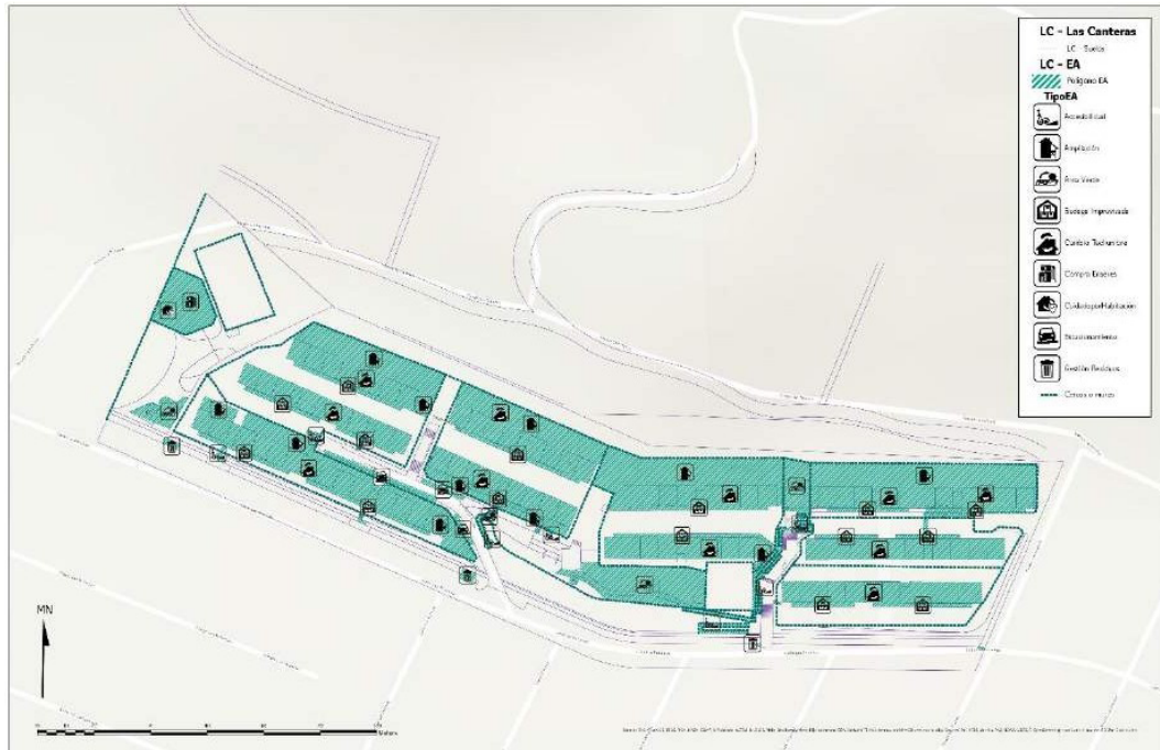
Figura N°2. Catastro de estrategias adaptativas en conjunto Las Canteras.