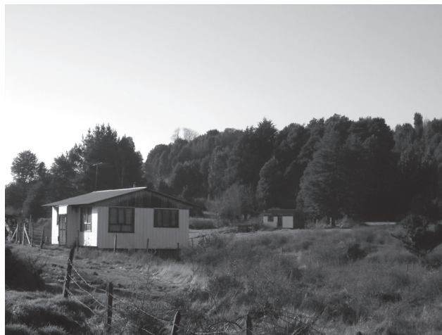
Figura N° 5 Casa en Sector Rural de Maullín (Puelpún).