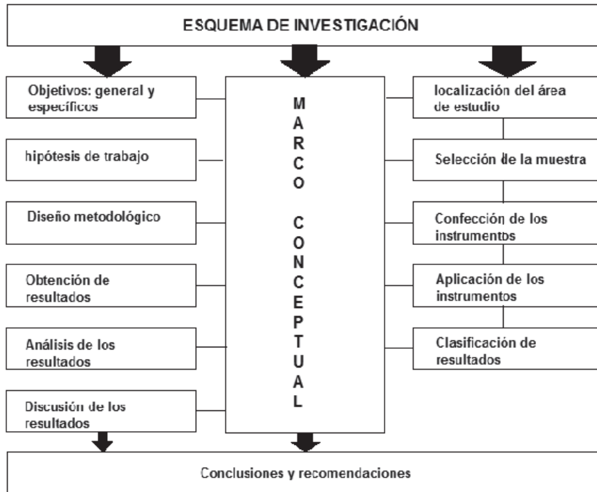
Figura N° 1 Etapas de la investigación