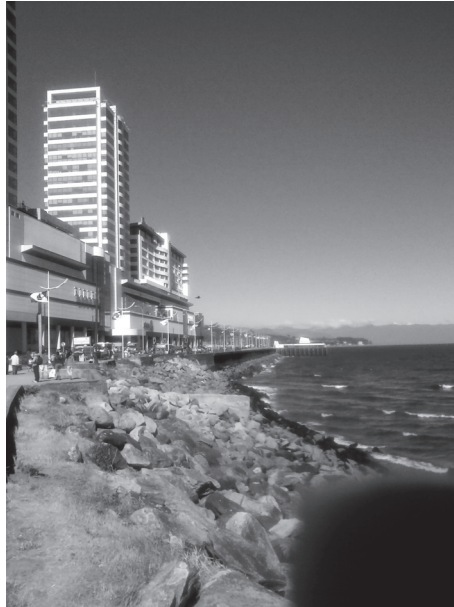
Figura N° 4 Vista del shopping mall Paseo Costanera 2014 Puerto Montt – Chile