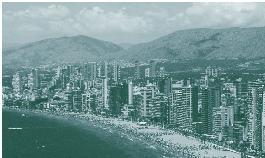
Figura 2: Vista aérea del enorme desarrollo territorial y urbano de la costa sureste de España.